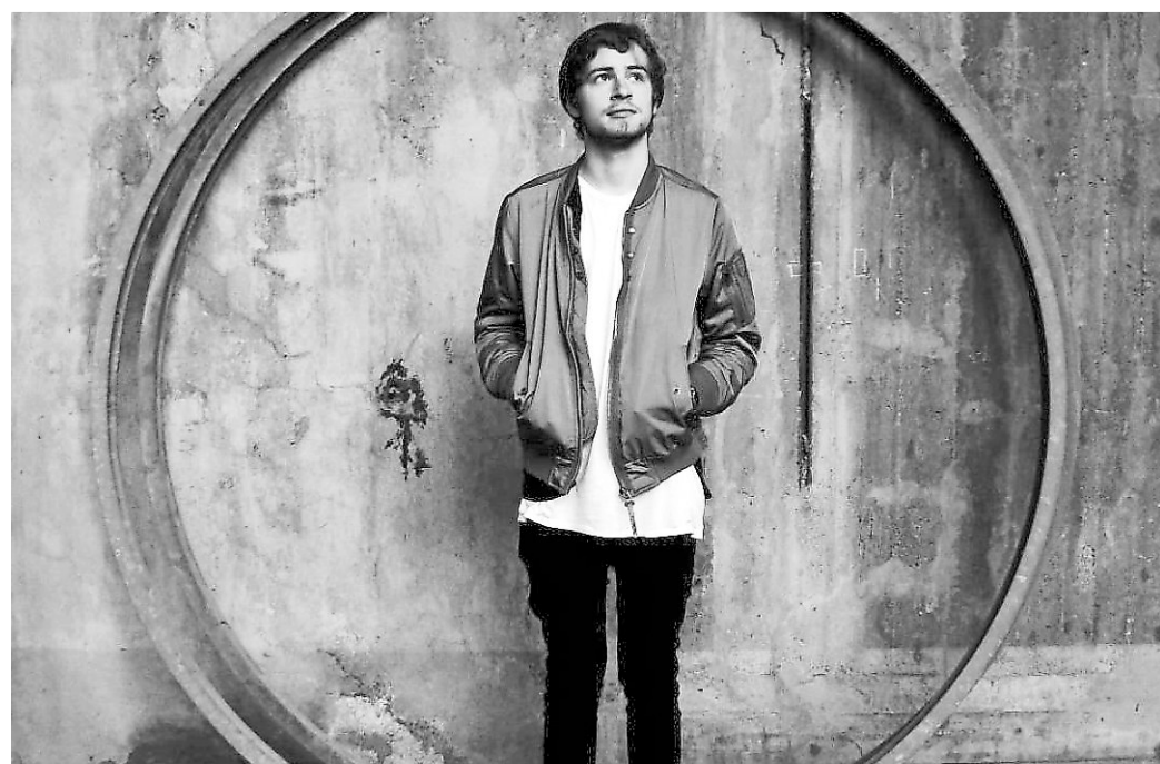
Kleinkind ist bei der Homecoming-Party im 50 Grad dabei.